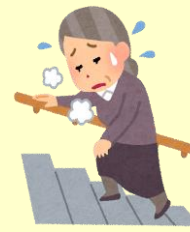
体力に不安のある方